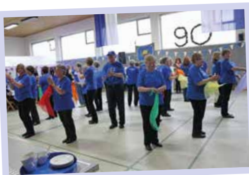
90ste Jubiläum 2014

Unter diesem Motto steht die Damengymnastik Sparte des MTV. Jeden 2. Dienstag im Monat treffen sich die Frauen ab etwa 60. Jahren zu einer Damen-/ Hockergymnastik. Ziel unserer Gymnastikstunde ist das Training von Herz- und Kreislauf, eine verbesserte Durchblutung und eine Mobilisation aller Gelenke sowie Kräftigung der Muskulatur.