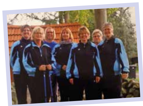
Laufgruppe von 2012