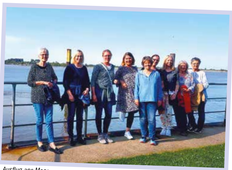
Ausflug ans Meer