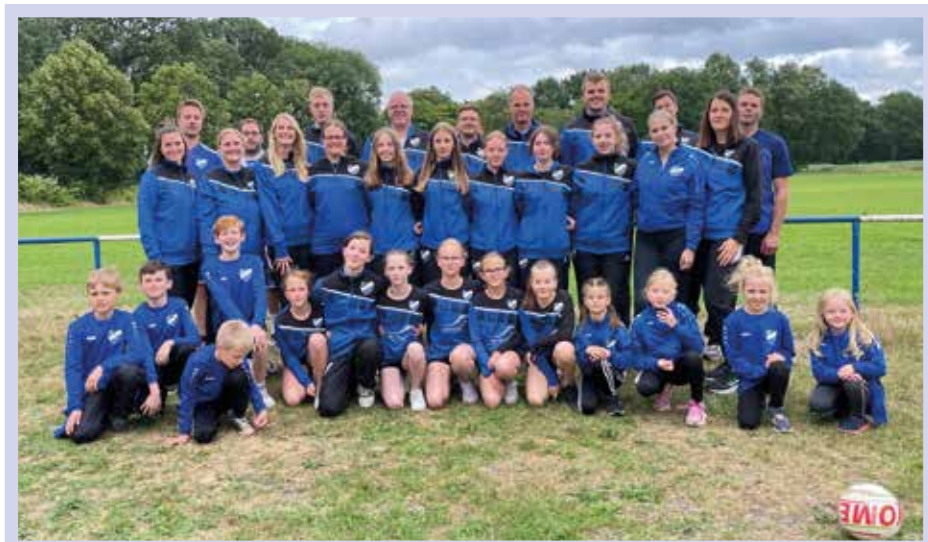
Unsere TeilnehmerInnen der Sparte Faustball 2023