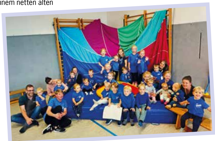
Eltern-Kind-Turnen von 2023