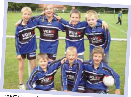
2007 Unsere Jugend

Nach dem Regen-Spieltag freuen sich die MTV-Faustballer jetzt aufs Finale mit Spitzenreiter Walsrode