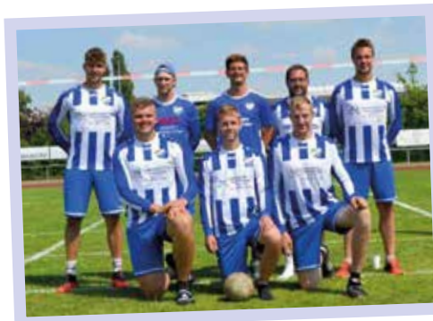
2023 1. Herrenmannschaft

Besonderes Highlight soll werden, ein Bundesliga Spieltag mit dem TV Brettorf: Berliner TS am 11. Mai 2024.