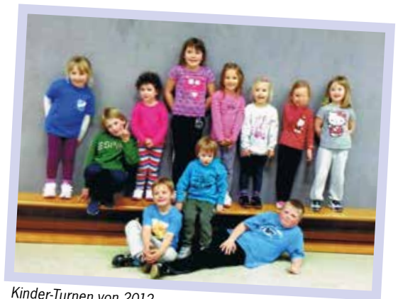
Kinder-Turnen von 2012