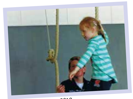
Kinder-Turnen von 2012